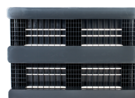
Laufbretter mit hohem Gleitreibwert