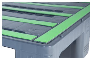
Anti-Rutsch-Streifen im Deck