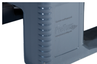
Folien-Rundung für einen sicheren Halt